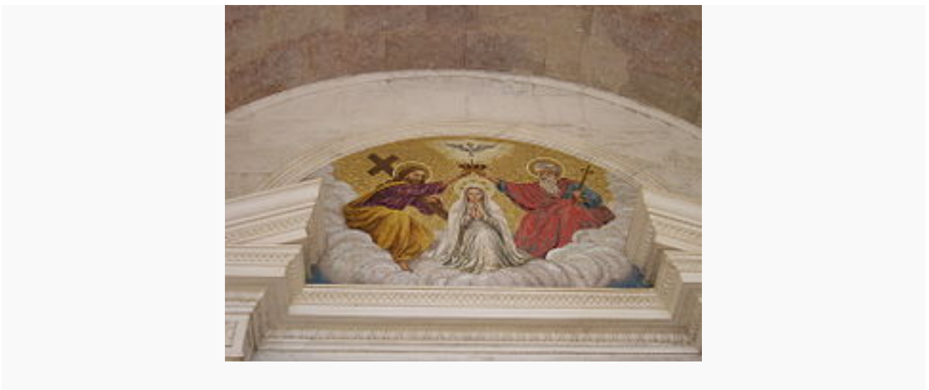
Mosaico con la Coronación de la Virgen