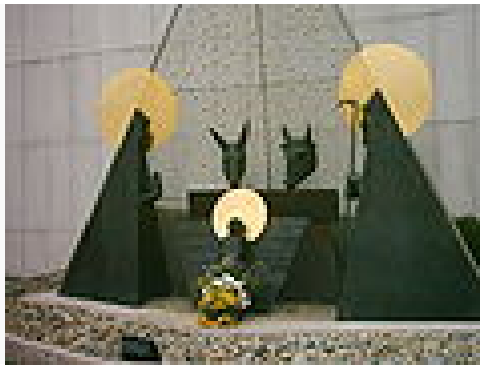
Escena del nacimiento de Jesús.