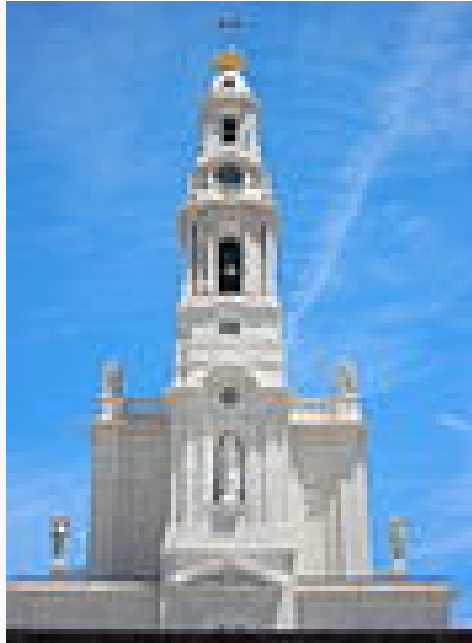
Torre de la Basílica del Rosario